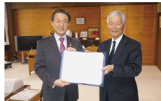
とっとりプラットフォーム5+ \alpha ※名称の由来: 鳥取県内の5つの高等教育機関+鳥取県および産業界

今後、本取組みがお互いの教育力、運営力を高め、さらに鳥取県の地域課題を解決できる一助になると信じています。